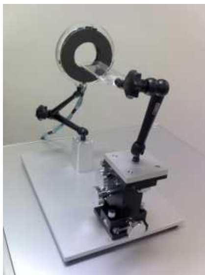
図4 開発した Si-PM-PET 装置