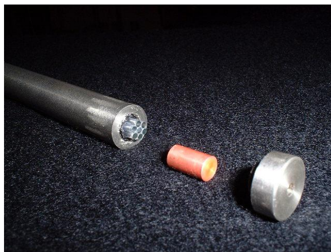
図1 MRI中で測定可能なガンマプローブ

ブルガンマプローブを開発するというものです。核医学装置が専門でしたので、MRIにはあまり馴染みがありませんでしたが、シンチレータやガンマ線遮蔽材料のMRI適合性を知るために磁化率の測定を行い、またMRI中の画質評価度を行いました[1-2]。